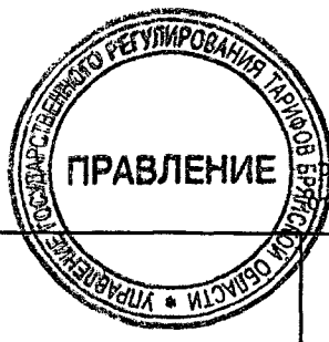
Таблица 2 к приказу управления государственного регулирования тарифов Брянской области от 25 декабря 2015 г. № 42/6-Э

КОПИЯ ВЕРНА Главный бухгалтер Бугрева П.И.